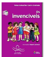
Paradidático: Os invencíveis Autor: Telma Guimarães Editora: Ed. Do Brasil