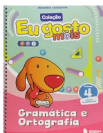
Gramática e Ortografia Eu Gosto Mais IBEP - Volume 4 Autor: Hermínio Sargentim